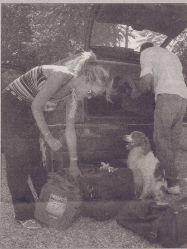
Lui, lei, il cane e i bagagli. Tutto è pronto per le vacanze

storico ione della pizza. w. campaniato-