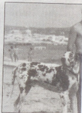
La spiaggia del Bau bau

A patto che il proprietario mostri all'ingresso dello stabilimento la documentazione sanitaria in regola e il certificato di buona salute rilasciato dal veterinario curante non più di 15 giorni